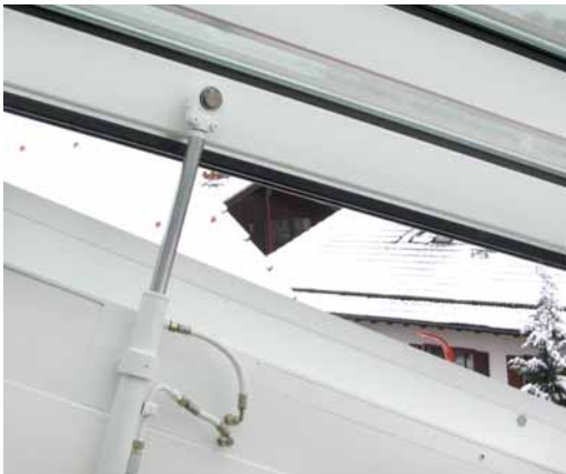
Hydraulischer Linearantrieb als Betätigungseinheit für ein Cabriodachfenster.